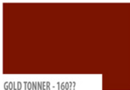
GOLD TONNER - 160??