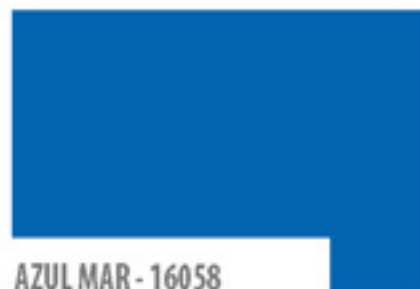
AZUL MAR - 16058