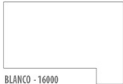
BLANCO - 16000