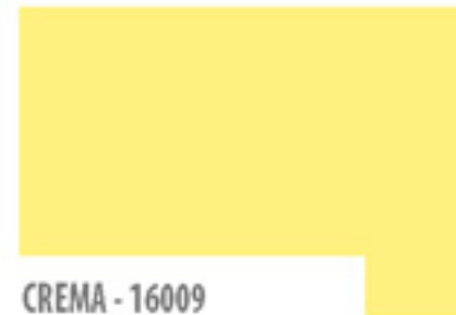
CREMA - 16009