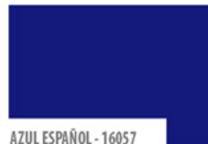
AZUL ESPAÑOL - 16057