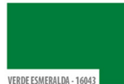
VERDE ESMERALDA - 16043