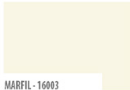
MARFIL - 16003