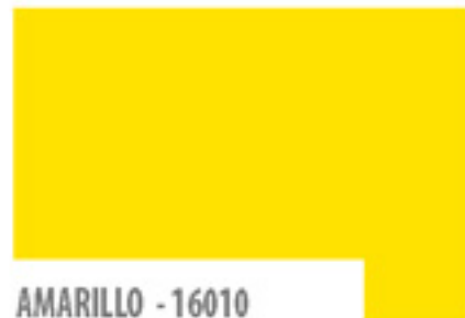
AMARILLO - 16010