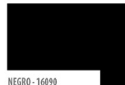
NEGRO - 16090