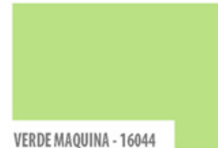
VERDE MAQUINA - 16044