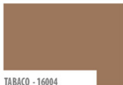
TABACO - 16004