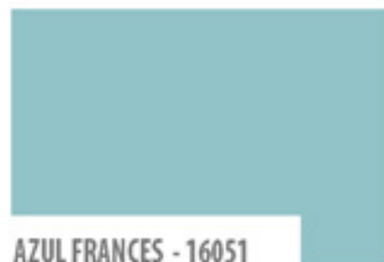
AZUL FRANCES - 16051