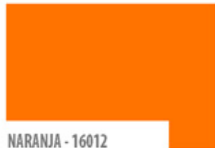
NARANJA - 16012