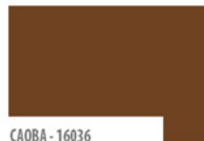
CAOBA - 16036