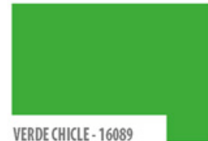
VERDE CHICLE - 16089