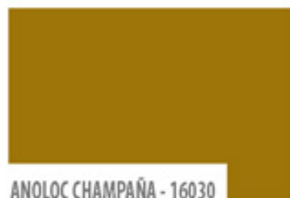
ANOLOC CHAMPAÑA - 16030