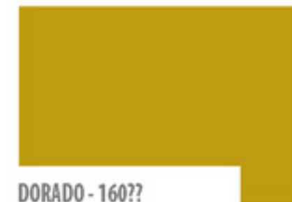
DORADO - 160??